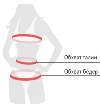
Таблица соответствия бюстгальтеров*